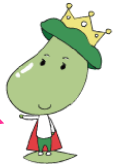
こまえ子育てわん キャラクター えだまめ王子