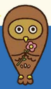
東京都福祉人材センターキャラクター フクシロウ