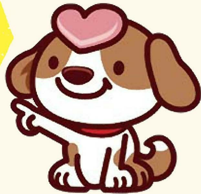
狛江社協マスコットキャラクター こまちゃん

狛江市内の福祉施設・事業所(障がい・保育・高齢)で働ける求人があります!! フルタイム、パートタイムなど雇用スタイルも様々です(資格や経験のない方も働ける職種あり)。 《過去の求人例:保育士、看護師、生活指導員、栄養士、介護職員ほか》 履歴書は原則不要ですが、面接を希望する場合はご持参ください。